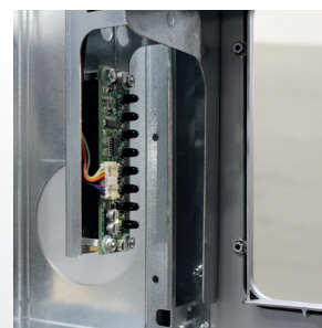
Fococélulas de reconocimiento de vasos de hasta 3 alturas diferentes